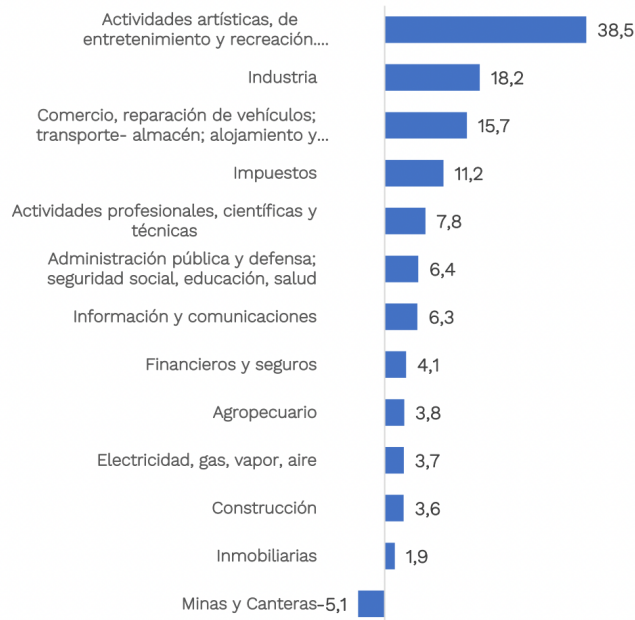
Gráfico 4 Crecimiento sectorial del PIB en primer semestre 2021, porcentaje